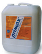
Vorratskanister 10 Ltr. Konzentrat ca. 900m 2